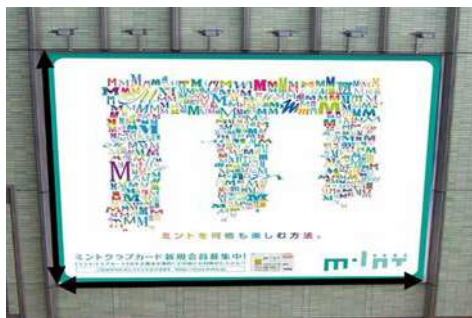
ミント神戸(カード会員募集)