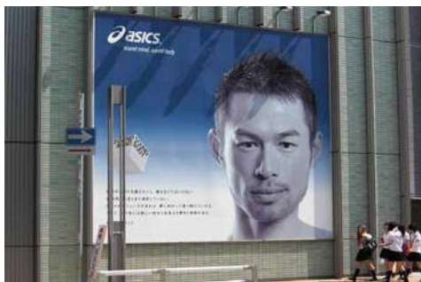
株式会社アシックス(イチロー選手)