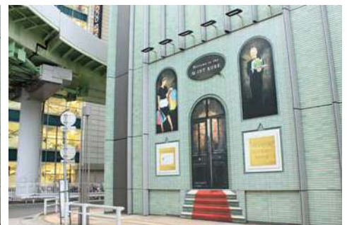
ミント神戸(だまし絵)